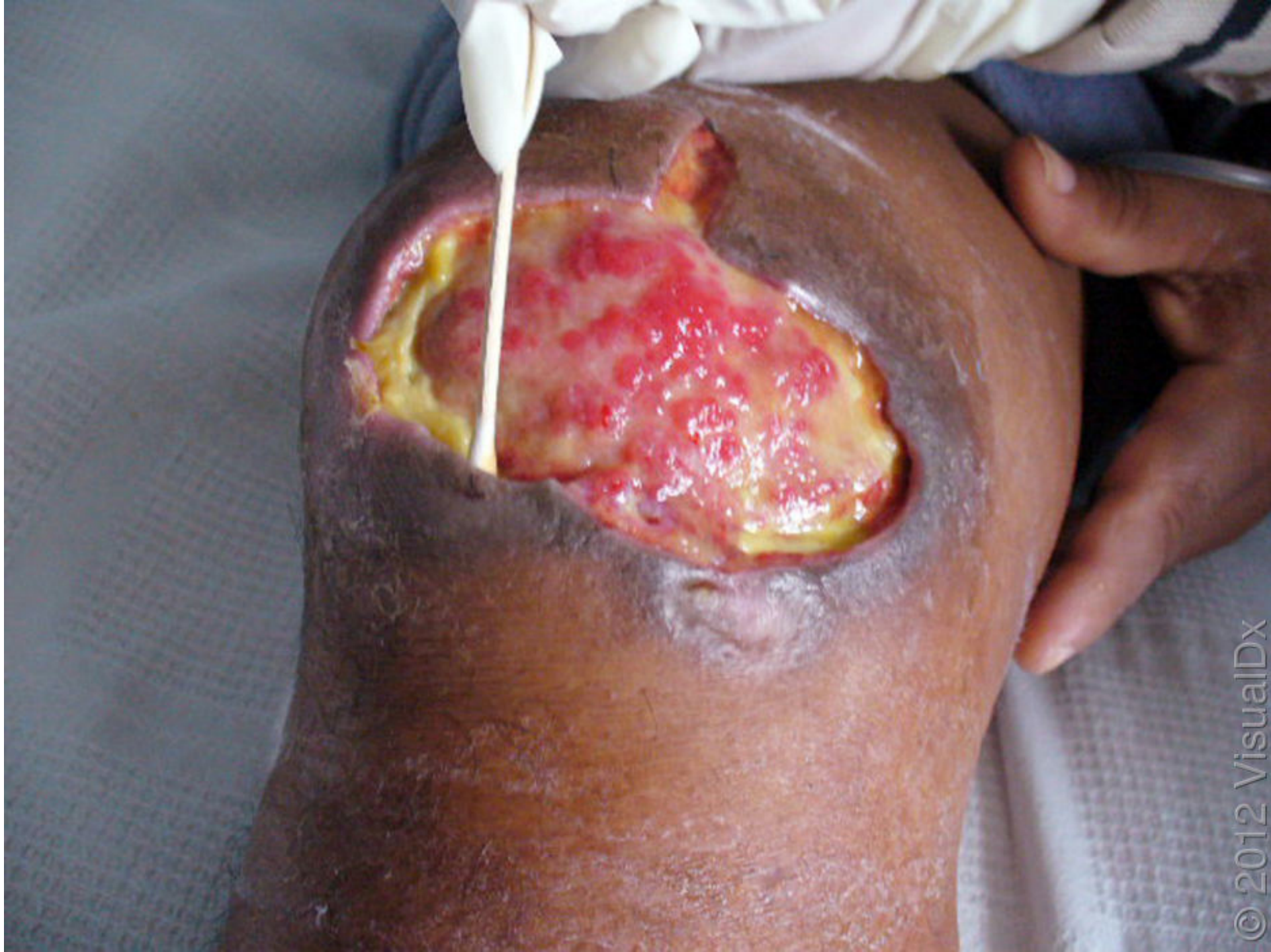
Ulcera de Buruli Mycobacterium ulcerans