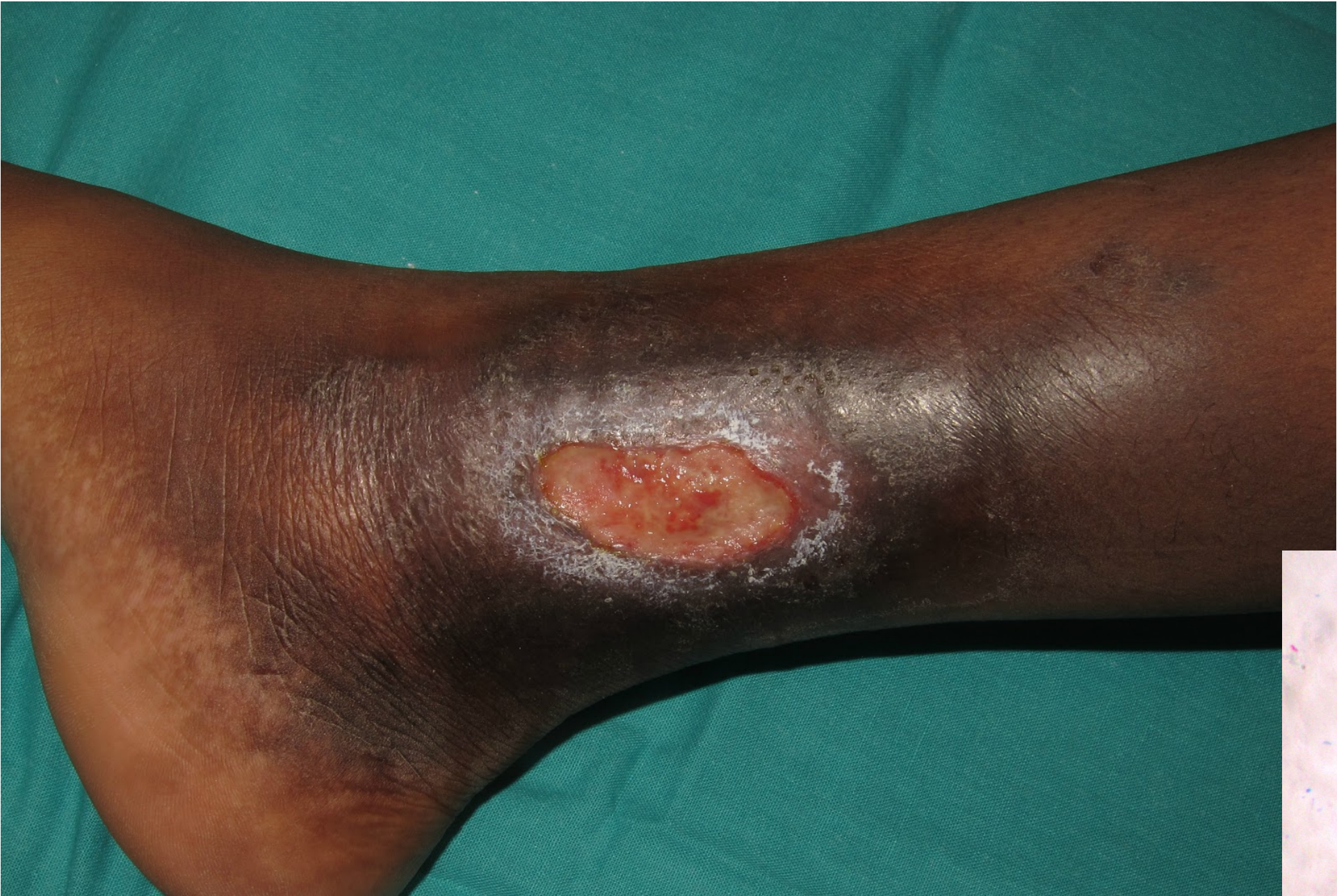
Ulcera de Buruli Mycobacterium ulcerans