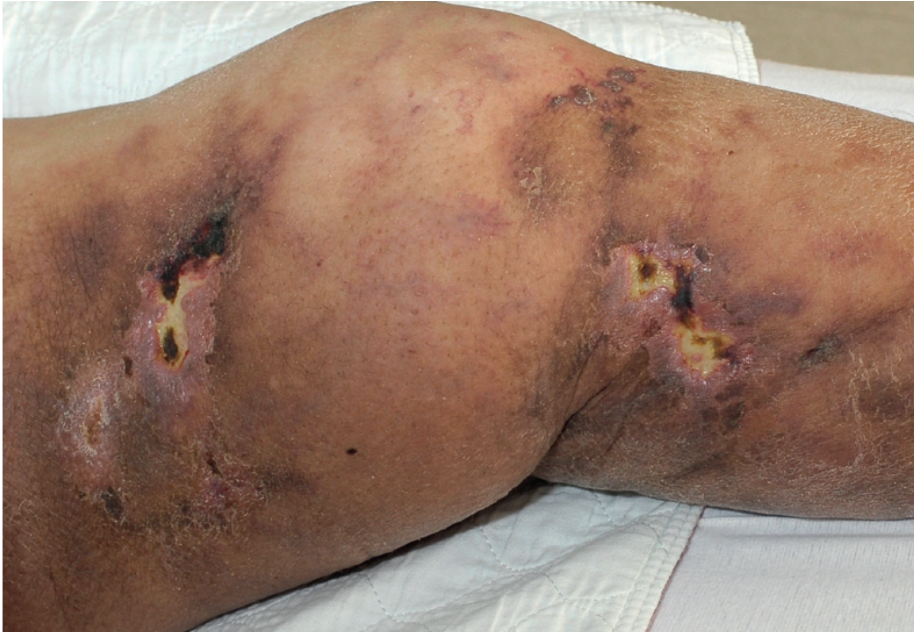
Linfoma B intravascular