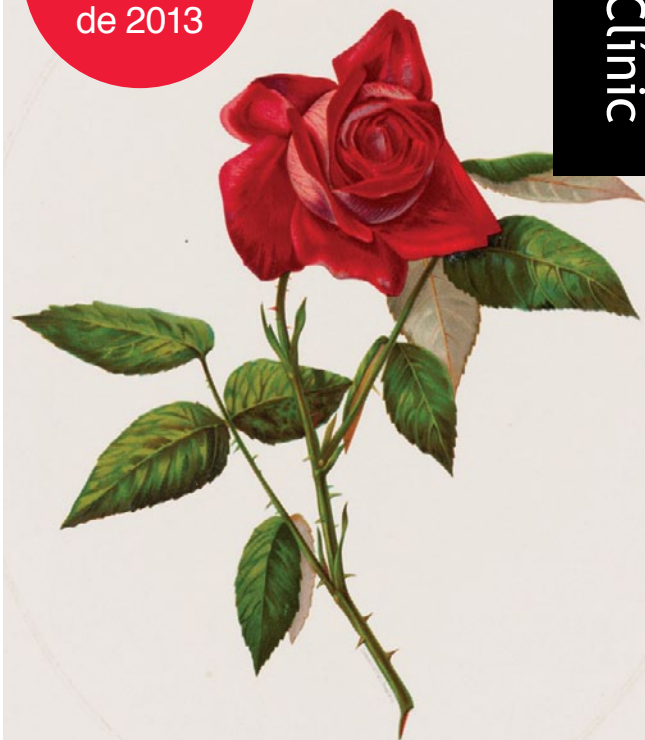
Red rose