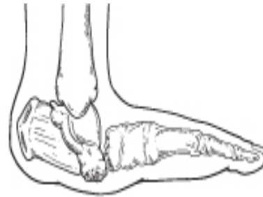
Pie de Charcot