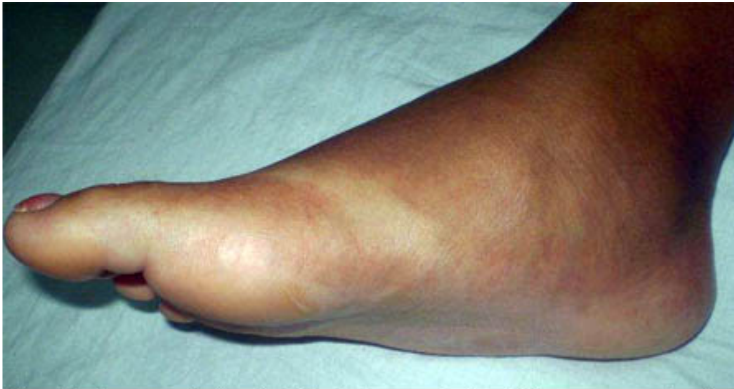
Fig. 2. Se aprecia la pérdida del arco plantar (pie en mecedora).