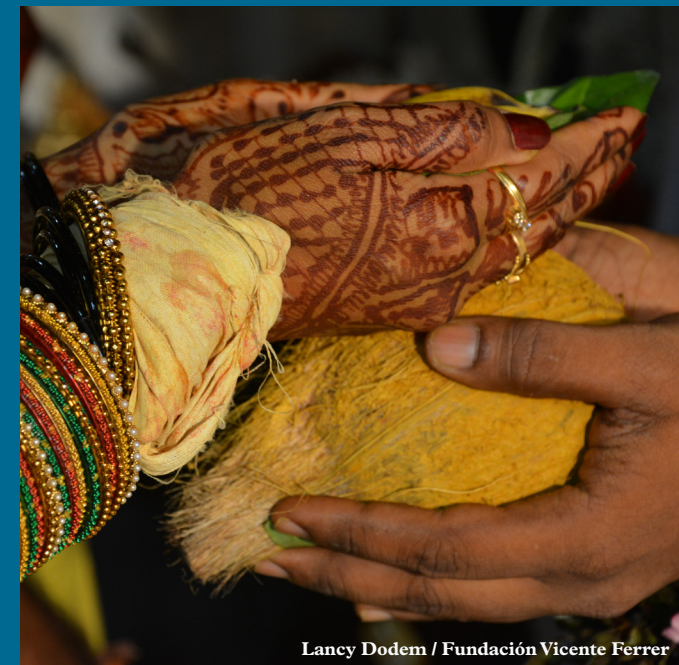
Lancy Dodem / Fundación Vicente Ferrer