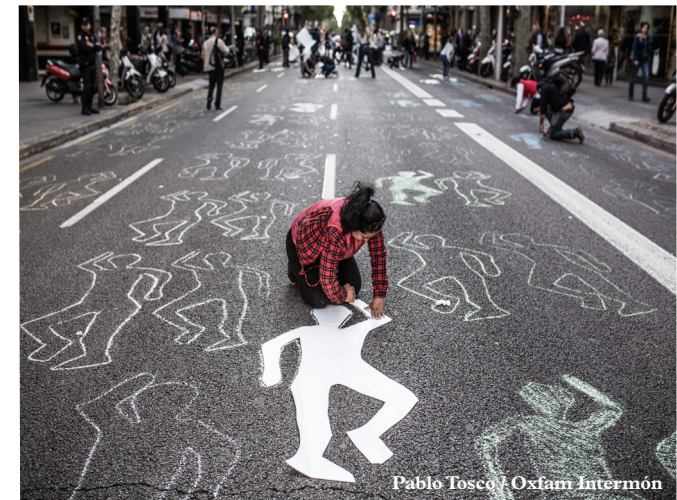
Pablo Tosco / Oxfam Intermón

Per inscriure's al simposi cal omplir aquest formulari web: www.isglobal.org/event-registration